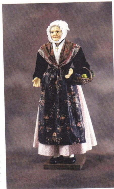
Santons de cire de la collégiale Saint-Jean de Pézenas (la piscénoïse et le meunier).

Nous ne ferons pas de « shopping » devant ce faux mystère. Le monde entier en a plein les yeux et les supermarchés, les médias et les enluminures se chargent de combler ces dévotions coûteuses.